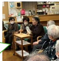
皆さん熱心に取り組んでいます

手を動かすゲーム、足を使ってキックベースボール、サウンドテーブルテニスの球を使って卓球など、座りながらできるレクリエーションが好評です