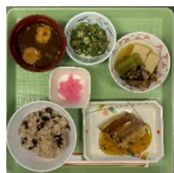
栄養の計算された昼食