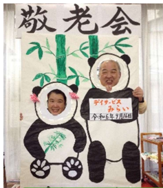
敬老会で職員と写真

春には花見、敬老の日には敬老会等の季節の催し、そして不定期に外出企画を行っております。