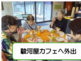
駿河屋カフェへ外出

春には花見、敬老の日には敬老会等の季節の催し、そして不定期に外出企画を行っております。