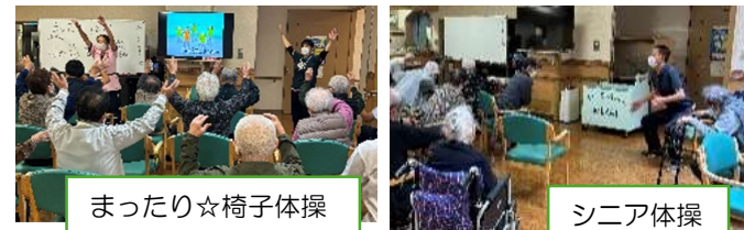
まったり☆椅子体操

レクリエーション(朝・昼)の時間には体操も選んでいただけます。月・木曜日午前中は下肢強化のための「シニア体操」火・金曜日午後からは座ったままで出来る「まったり☆椅子体操」があります。